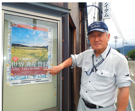
有限会社 上津野デイトム