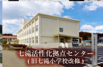
七滝活性化拠点センター (旧七滝小学校改修)